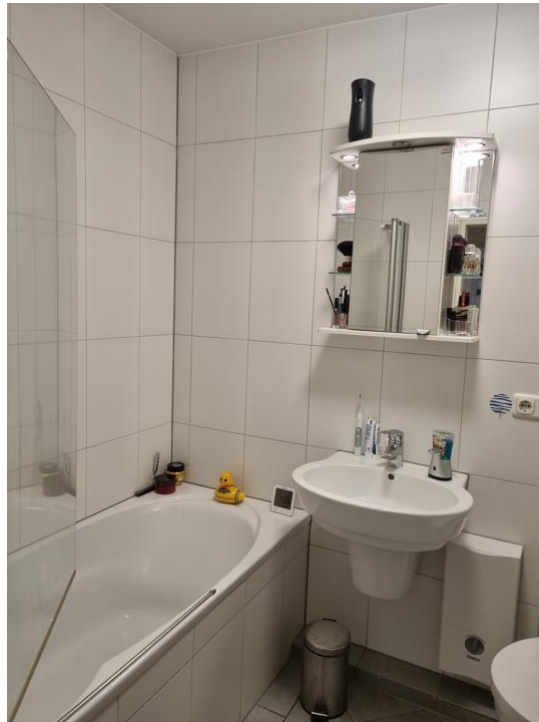
BAD mit Wanne