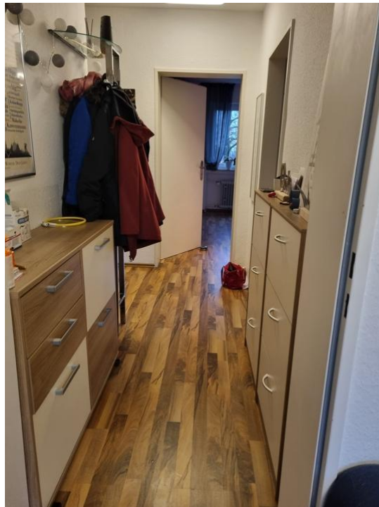
Flur mit Garderobe