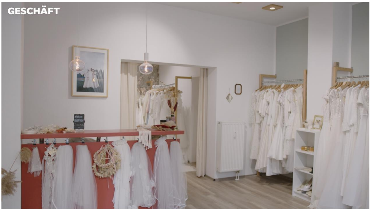
Bildschirmfoto 2025-01-02 um 18.39.48 Kopie