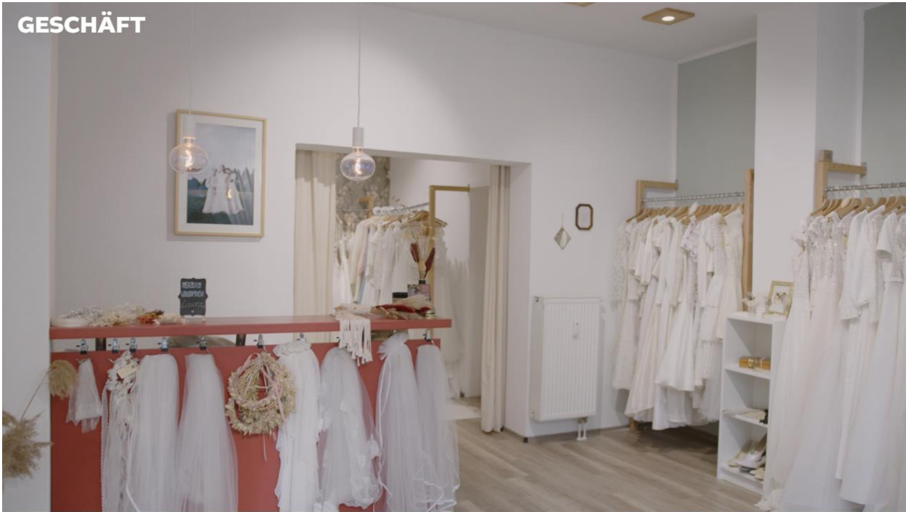
Bildschirmfoto 2025-01-02 um 18.39.48 Kopie